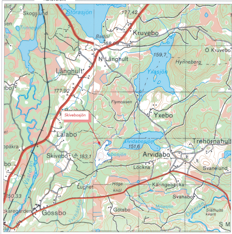
Skala 1:35 000. Ur karta © Lantmäterverket Gävle 2003. Modgivande M2005/1224.